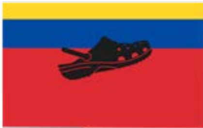
Diseño: Andres Bonifaz sobre bandera de Santiago Alarcón.